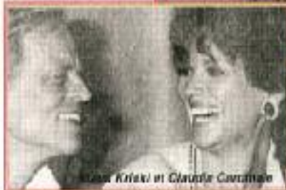
Klaus Kinski et Claudia Cardinale