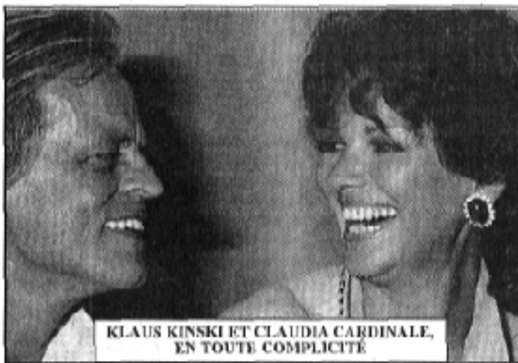
KLAUS KINSKI ET CLAUDIA CARDINALE, EN TOUTE COMPLICITÉ

Toutes ces stars (acteurs, actrices, réalisateurs) sont présentes sous forme de belles photos artistiques en noir et blanc, réalisées par Roger Del Rio qui a couvert des entrées durant le Festival International du Film de Cannes, dont il nous propose quarante images.