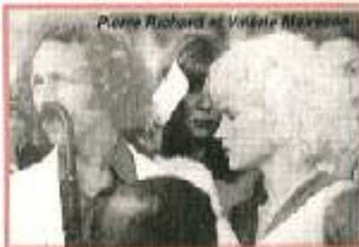
Pierre Richard et Valérie Mairesse