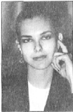
«أحدى صور لنجوم مهرجان «كان»»