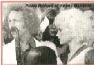
Pierre Richard et Valérie Mairesse