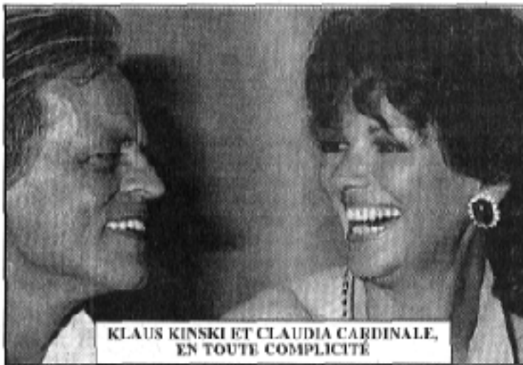
KLAUS KINSKI ET CLAUDIA CARDINALE, EN TOUTE COMPLICITÉ

Toutes ces stars (acteurs, actrices, réalisateurs) sont présentes sous forme de belles photos artistiques en noir et blanc, réalisées par Roger Del Rio qui a couvert des entrées durant le Festival International du Film de Cannes, dont il nous propose quarante images.