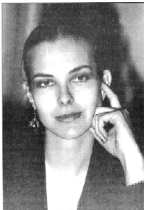
Portrait de Catherine Deneuve