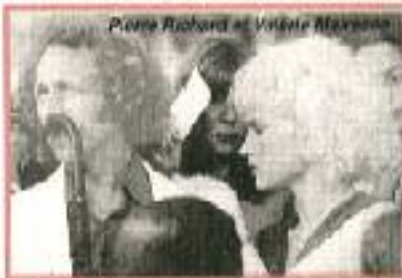
Pierre Richard et Valérie Mairesse