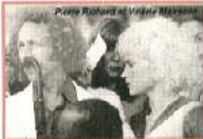
Pierre Richard et Valérie Mairesse