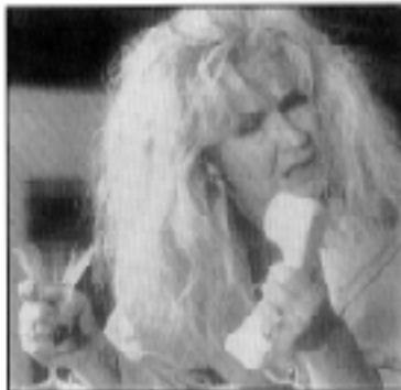
Diane Ladd som Lulas mor, og som «The Wicked Witch of the East».

Marietta er imidlertid slett ikke fornøyd med tingenes utvikling og leier den sympatiske, men altfor naive privatdetektiven Johnnie Færugut (Harry Dean Stanton) til å spore dem opp og bringe datteren hjem. Når Færugut ikke er rask nok til å komme opp med resultater, kontakter han sin tidligere elsker, gangsteren Marcello Santos (J. E. Freeman), og inngår dermed en kontrakt med fæen sjøl.