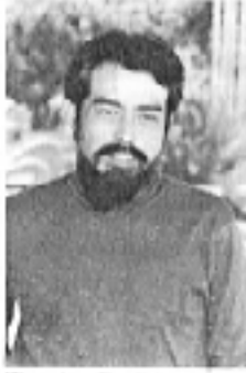
Filmregissør Chen Kaige - Kina

Et stjelpesvarege opphold er en del av livet for de fleste, med trønderer som vil gi uttrykk om det som er det ikke betyr verdt å bli en konge på den fotograferingen kan bli. Men han (1) (2) (3) (4) (5) (6) (7) (8) (9) (10) (11) (12) (13) (14) (15) (16) (17) (18) (19) (20) (21) (22) (23) (24) (25) (26) (27) (28) (29) (30) (31) (32) (33) (34) (35) (36) (37) (38) (39) (40) (41) (42) (43) (44) (45) (46) (47) (48) (49) (50) (51) (52) (53) (54) (55) (56) (57) (58) (59) (60) (61) (62) (63) (64) (65) (66) (67) (68) (69) (70) (71) (72) (73) (74) (75) (76) (77) (78) (79) (80) (81) (82) (83) (84) (85) (86) (87) (88) (89) (90) (91) (92) (93) (94) (95) (96) (97) (98) (99) (100)