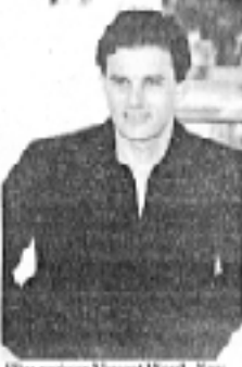
Filmregissør Vincent Ward - New Zealand