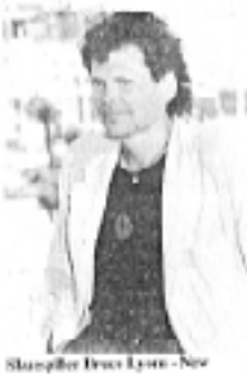
Skuespiller Bruce Lyon - New Zealand