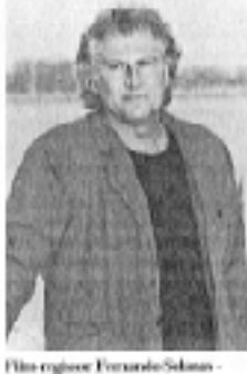
Filmregissør Fernando Solanas - Argentina