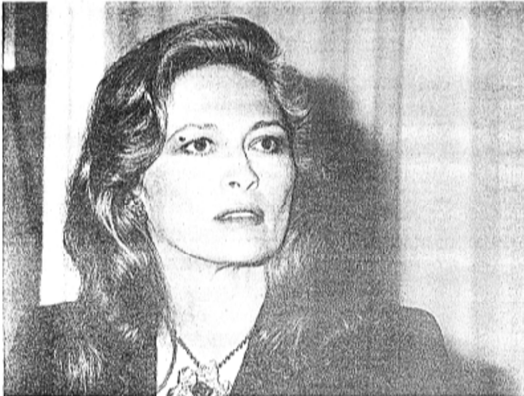
«A goddess in distress» - Faye Dunaway som Bukowskis Wanda. Her avsløjet på forrige Cannes-festival.

Tysv år etter «Bonnie and Clyde» kommer Faye Dunaway som Bukowskis Wanda i «Barfly». Via filmserien «Chinatown», «Network», «The China» og sist «Mommie Dearest», helinnen er den samme glattblonde ekte.