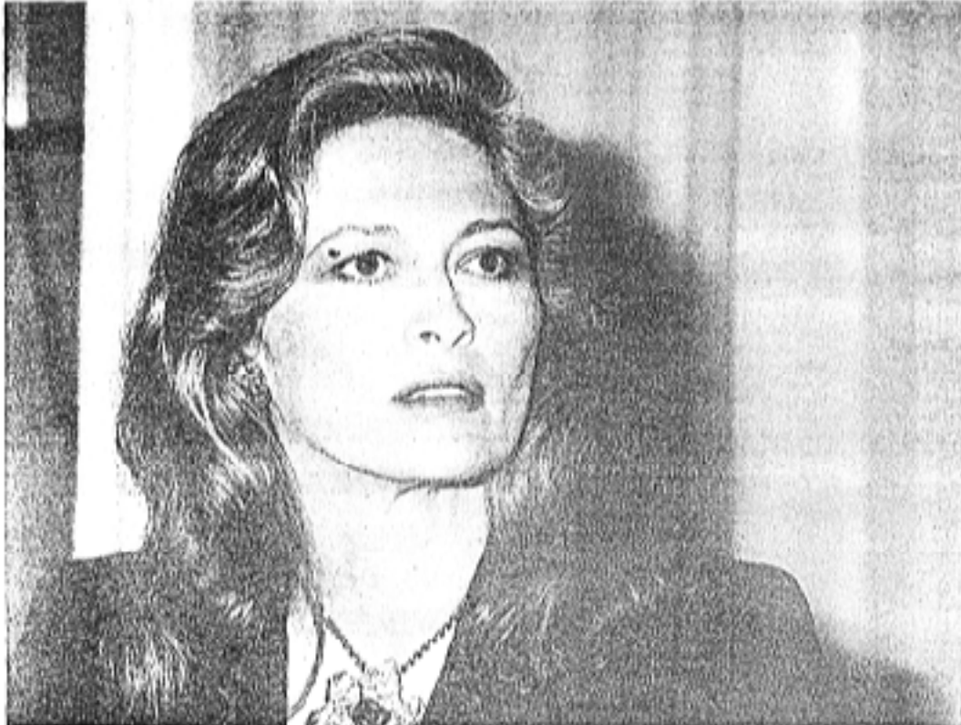
«A goddess in distress» - Faye Dunaway som Bukowskis Wanda. Her avsløret på forrige Cannes-festival.

Tysv år etter «Bonnie and Clyde» kommer Faye Dunaway som Bukowskis Wanda i «Barfly». Via filmer som «Chinatown», «Network», «The China» og sist «Mommie Dearest», helinnen er den samme glattblonde ekte.